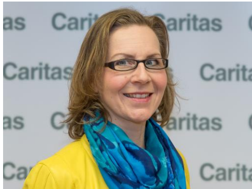
Amstetten, Scheibbs, Waidhofen a. d. Ybbs

Beratungsstelle Amstetten Hauptplatz 37 3300 Amstetten