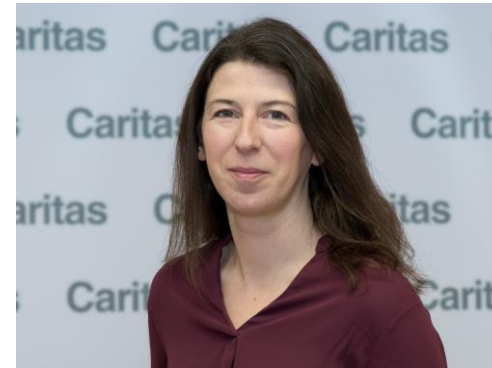
Amstetten, Scheibbs, Waidhofen a. d. Ybbs

Beratungsstelle Amstetten Hauptplatz 37 3300 Amstetten